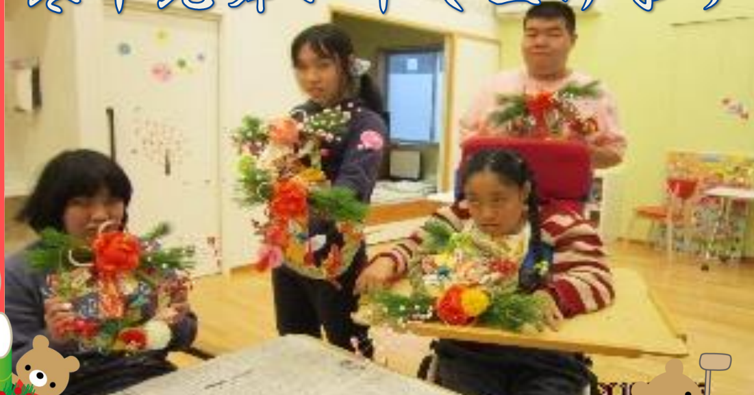
フラワーアレンジメントでお正月飾りを作りました。