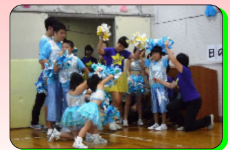
<日の出福祉園祭「サンサンフェスタ」>開催日：2018年9月23日（水・祝） 会場：日の出福祉園