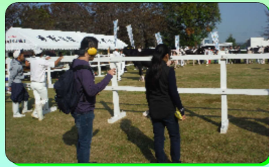
青梅畜産センター祭りにて