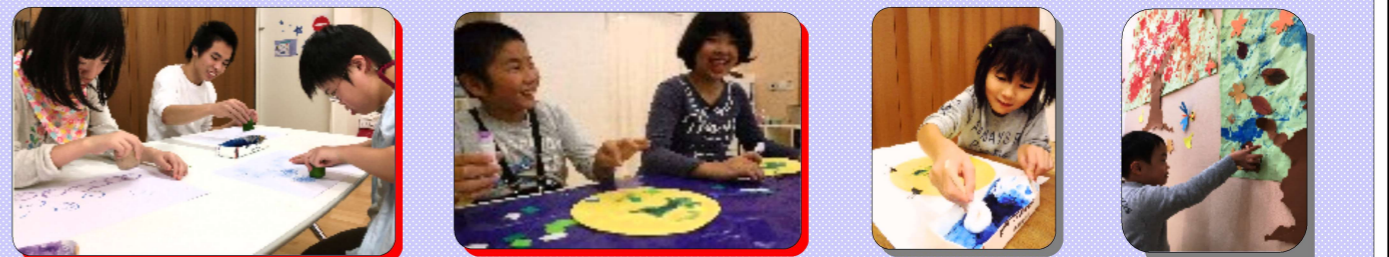
野菜スタンプでアートを作成中!

<制作活動>野菜でスタンプを作ったり、11月には子どもたちが自分の手に絵の具を塗り、壁に貼られた大きな樹にたくさんの自作葉っぱをつけました。その鮮やかさは、まるで紅葉です!