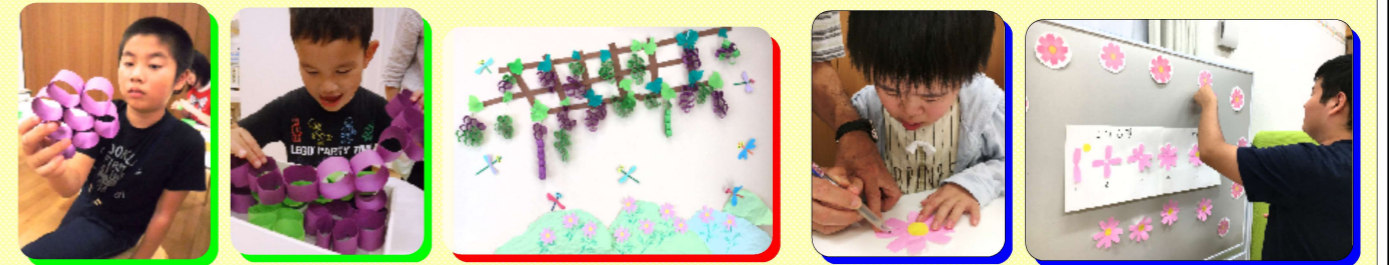
美味しそうなブドウとトンボができたよ♪

グループ学習は単なる学習ではなく、みんなと一緒に季節を感じたり、一つのものを作り上げて達成した喜びを感じたりしています。初秋のグループ学習で作った作品には、気持ちよさそうに飛んでいるトンボや、美味しそうな実がたくさんついたブドウがあります。これらがありえすの室内に飾られていた時、子どもたちの元気な姿と重ね合わせると、どこかの丘や草原が連想されるかのようです。