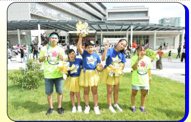
<おーちゃんフェスティバル>開催日：2018年9月16日（日） 会場：青梅市役所西側広場・会議室