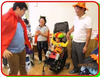
トリック オアトリート