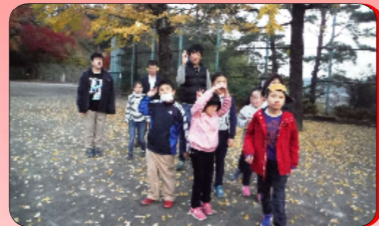
晩秋の青梅永山公園散策