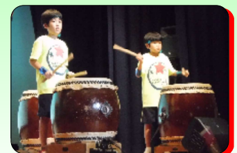
<いきいきふれあいフェスティバル>開催日：2018年10月7日（日） 会場：羽村市コミュニティセンター