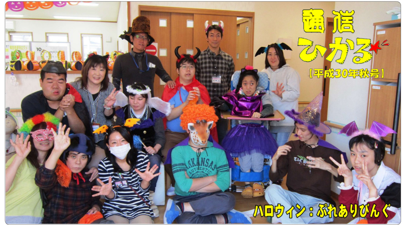
ハロウィン：ふれありびんぐ