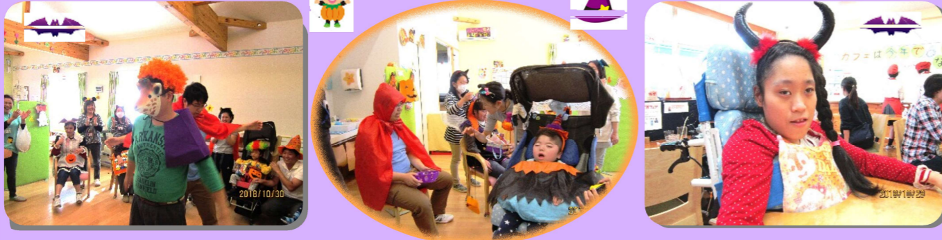
事業所内でのハロウィン