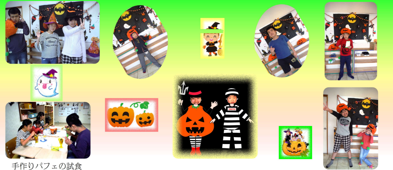
手作りパフェの試食

手作りパフェ材料の買い物をしてかららんらんでパフェ作りをして食べました。その後玄関のハロウィン飾りをバックに仮装をして記念撮影をしました。