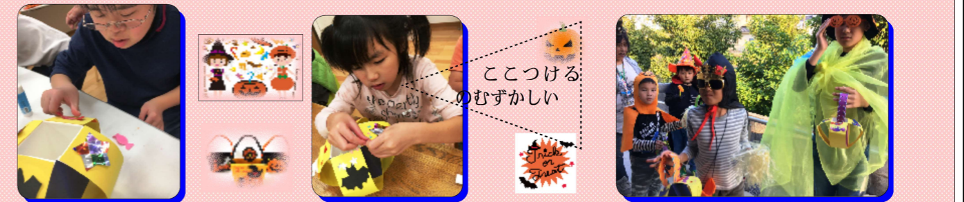
お菓子を入れる箱を作ってます!

<ハロウィン>ハロウィンの時はおかし箱を作成し、おばけなどに仮装して呪文に「Trick or Treat!」と言いながら、美味しなお菓子をもらいに行きました!!