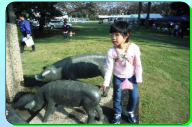
あきるの学園ふたば祭見学