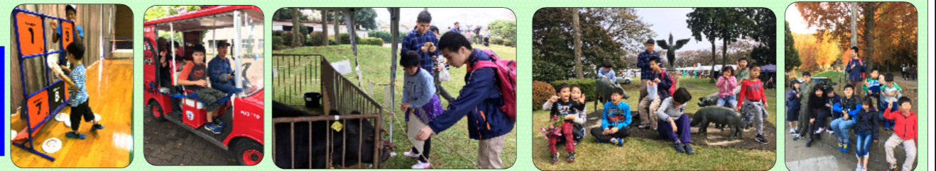
あきる野市障がい者防災・スポーツフェアにて 家畜ふれあいデーにて（旧：畜産試験場）