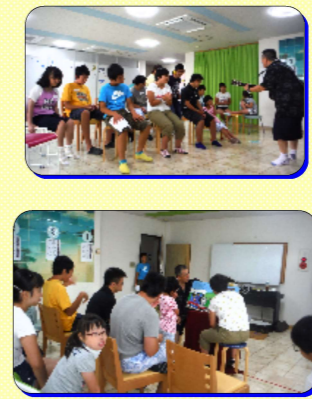
ありえず事業所にて